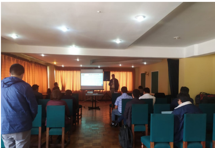
Reunión con empresas Distribuidoras de electricidad